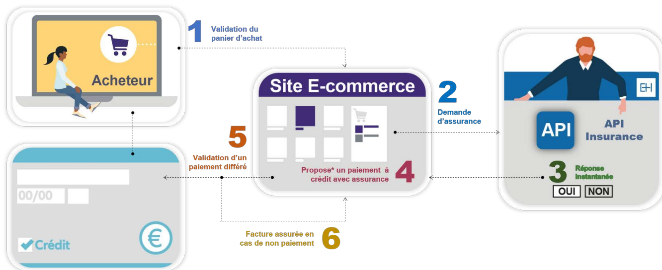
Schéma d'une transaction assurée