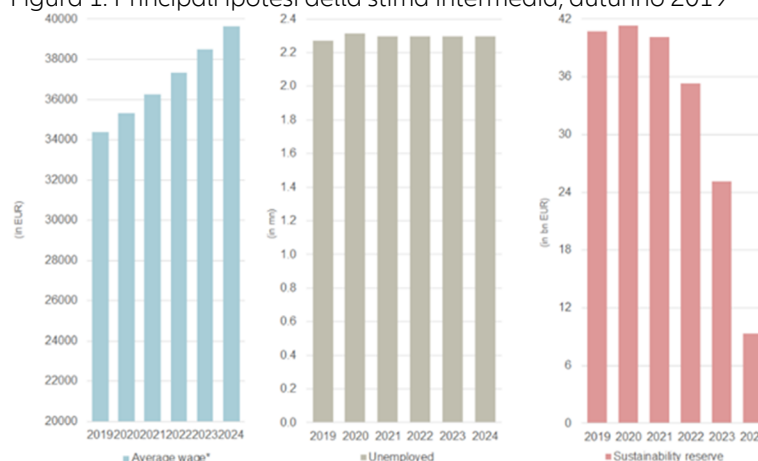
Figura 1: Principali ipotesi della stima intermedia, autunno 2019

* qui: Germania Ovest, salario medio contributivo all'anno