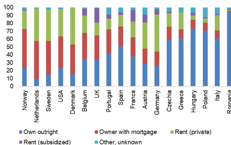
Figura 2 - Quota di famiglie per tipo di abitazione, in %).

Finché non ci sarà un vaccino efficace contro Covid-19 i Paesi rimarranno vulnerabili a nuovi focolai della pandemia, che porterebbero a ripetute fasi di blocco e di riavvio. La reazione ovvia delle famiglie sarà quella di aumentare i risparmi, in particolare in quei paesi con alti livelli di indebitamento delle famiglie e disoccupazione in aumento (paesi nordici, Paesi Bassi, Regno Unito e, in misura minore, Francia, Belgio, Spagna e Portogallo, si veda il grafico 2).